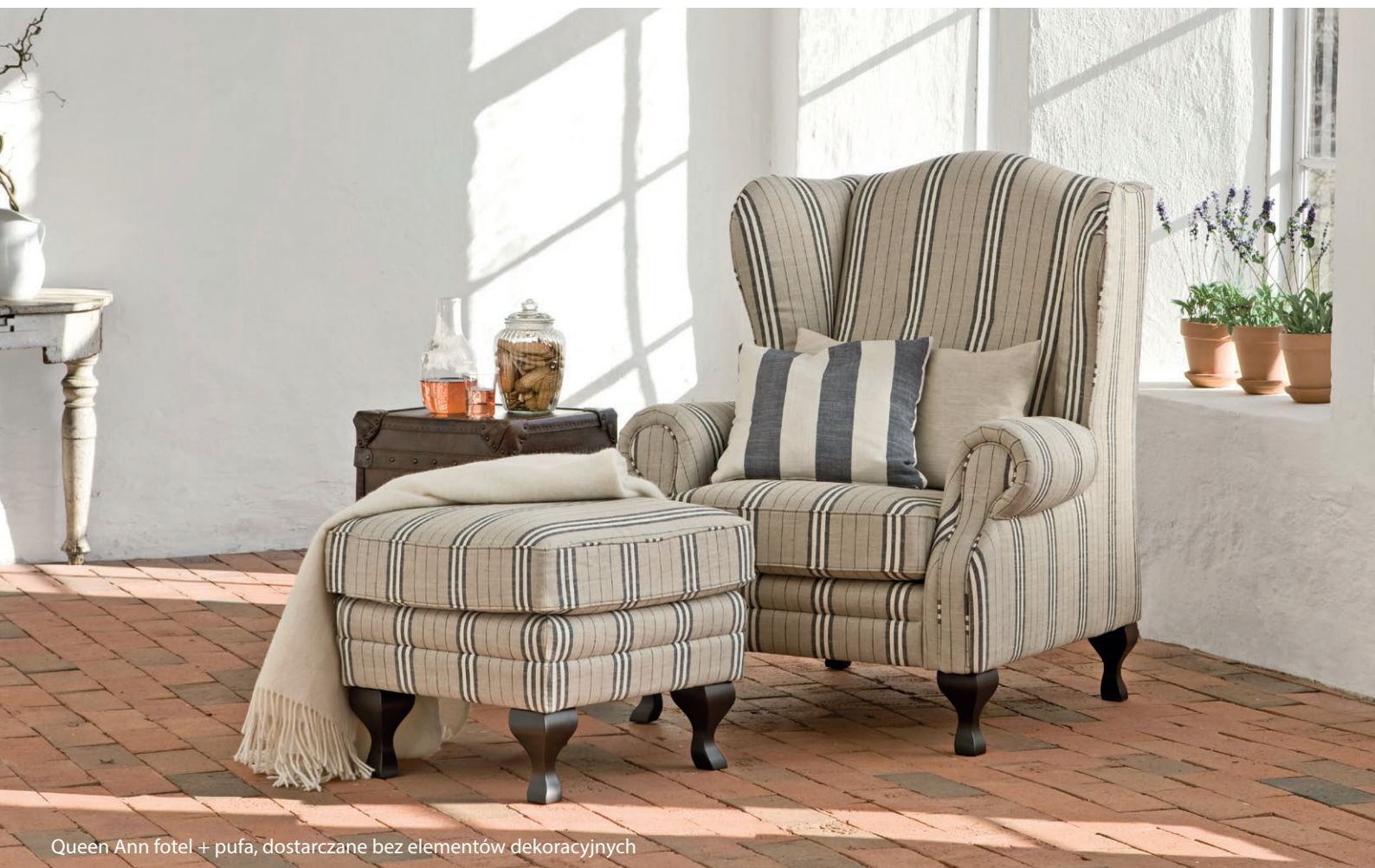
Queen Ann fotel + pufa, dostarczane bez elementów dekoracyjnych