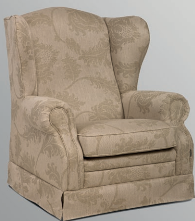
Queen Ann L/S (Long Skirt)