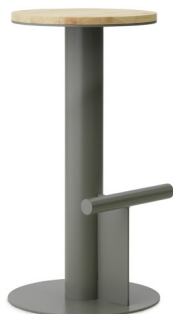
Pole Barstool 75 cm Grey