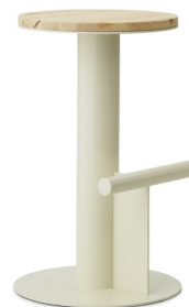
Pole Barstool 65 cm Sand