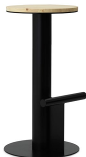
Pole Barstool 75 cm Black