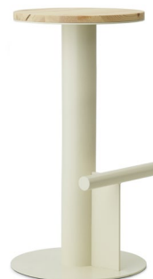
Pole Barstool 75 cm Sand