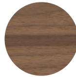
Noce Canaletto Canaletto Walnut