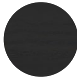
Frassino Nero Black Ash