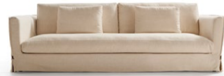
OP1 (1 cushions)

Solano es un sofa que propone la vuelta a los cánones clásicos de esta tipología, hasta el punto de que algunos componentes pierden su propia volumetría disolviéndose en una serie de almohadones. Un