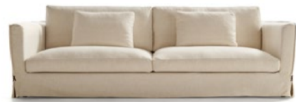
OP2 (2 cushion)

2. Seat cushion formed from a block of HR 35 kg/m 3 foam of soybean oil. Covered with a cotton cover and filled with microfibres made from 60% down touch padding plus 40% polyester silicone